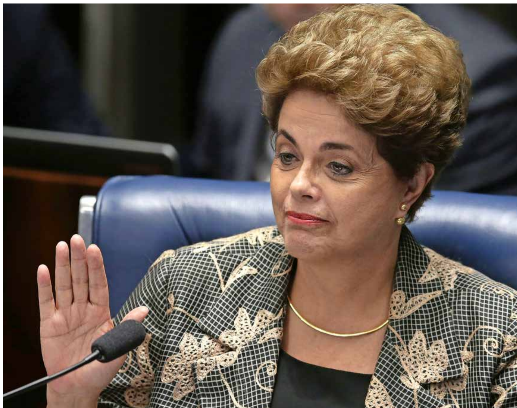
La désormais ex-présidente Dilma Rousseff a tenté en vain, cette semaine, de prouver sa bonne foi et son honnêteté.

CRISE La présidente du Brésil Dilma Rousseff a été destituée hier par le Sénat pour maquillage des comptes publics, au terme d'une procédure hautement contro-