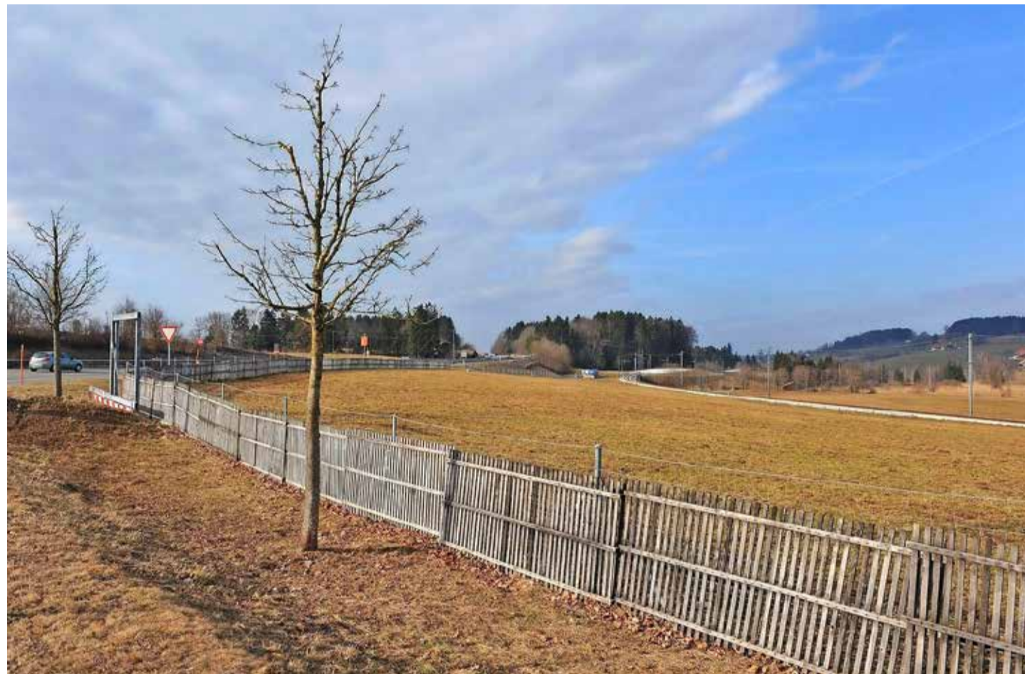
L'aire multifonctionnelle de la Joux-des-Ponts occupera le terrain situé entre l'aire de repos actuelle et la voie ferrée.

Maître d'œuvre de ce projet de réaménagement, la Confédération ne s'y est pas trompée: la priorité est de réaliser l'aire mul-