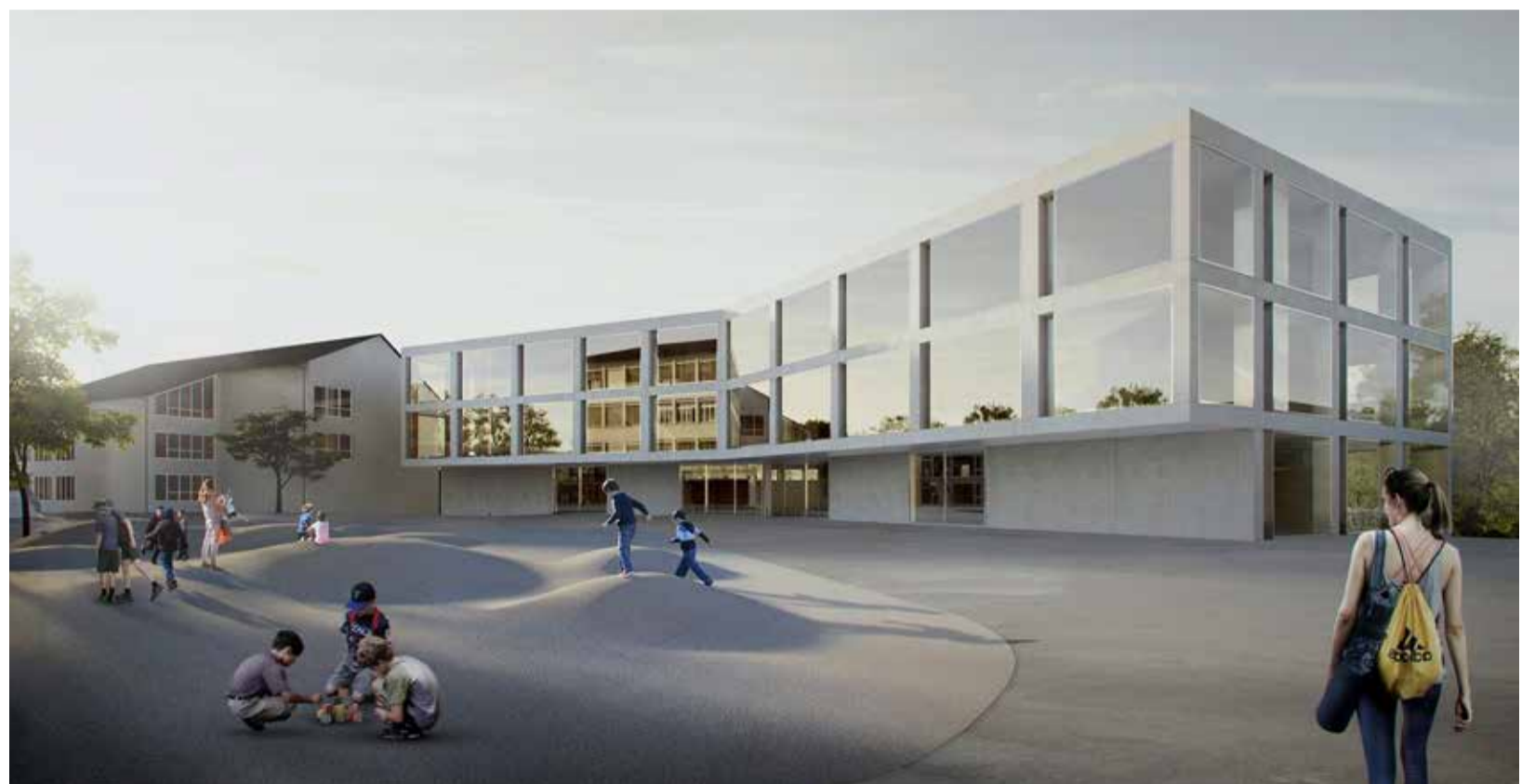
Les lauréats veulent redéfinir le périmètre de l'établissement scolaire en y donnant une nouvelle cohérence. DR/Image de synthèse

L'extension, dont le coût global est évalué à 30 millions de francs, est prévue en deux phases. Au sud