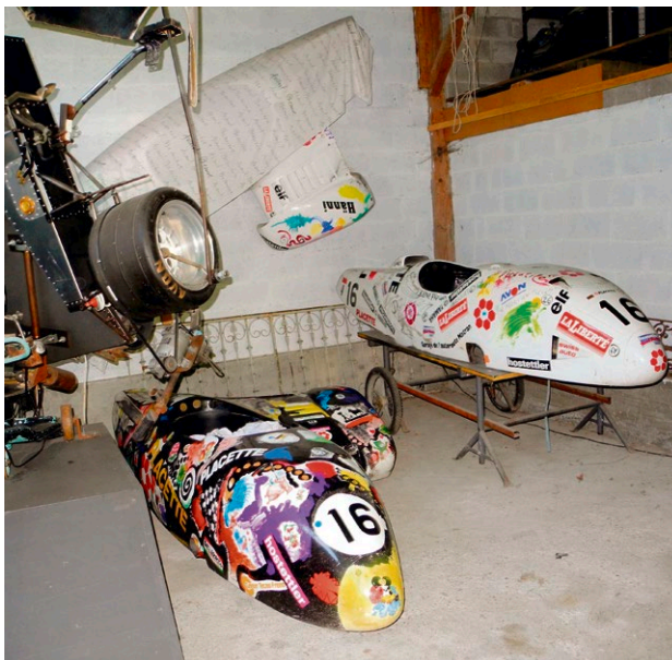
Quelques-unes des carrosseries de side-car signées Tinguely.