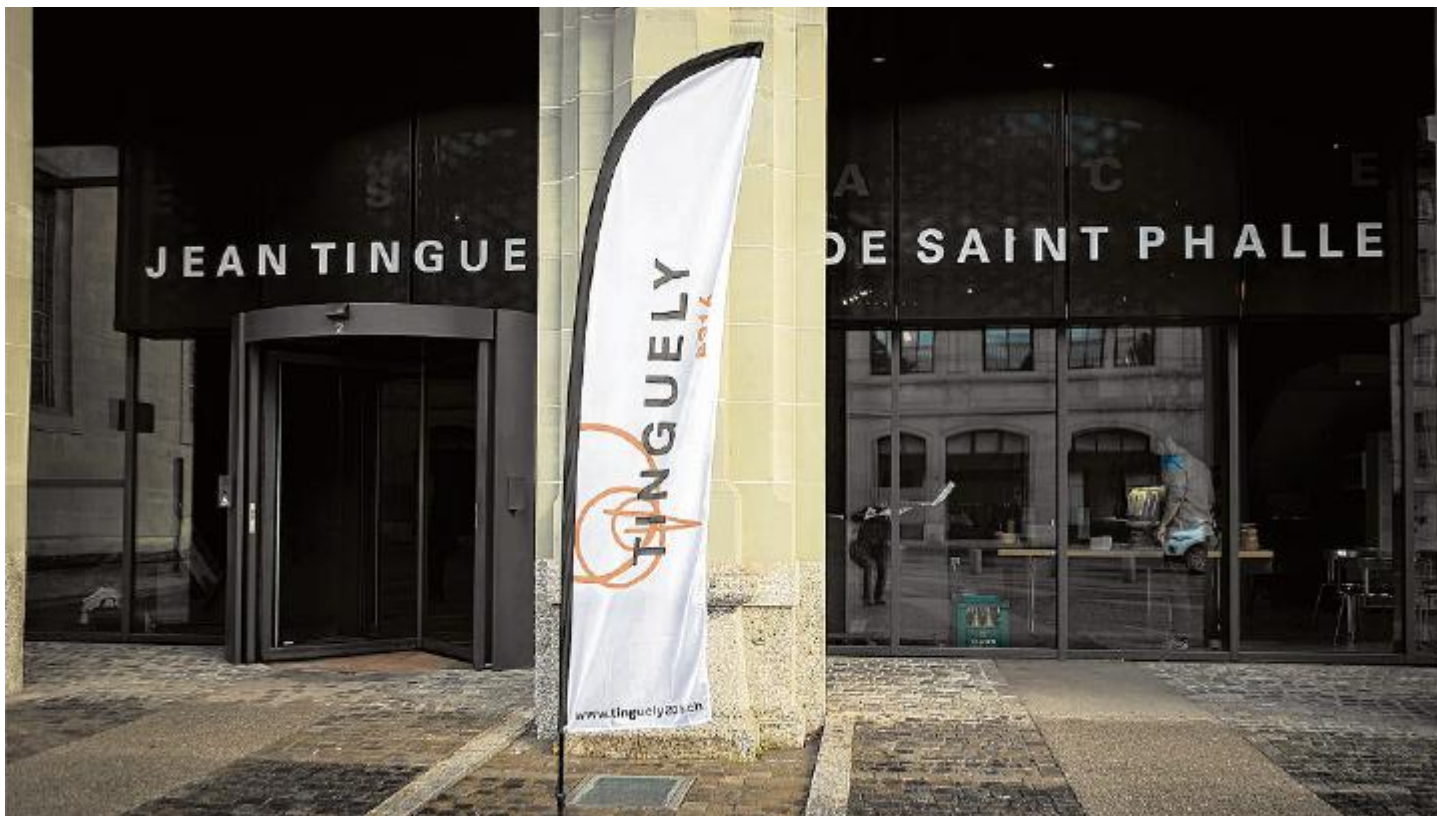
Im Espace Jean Tinguely – Niki de Saint Phalle haben die Verantwortlichen gestern das Tinguely-Jahr 2016 vorgestellt.